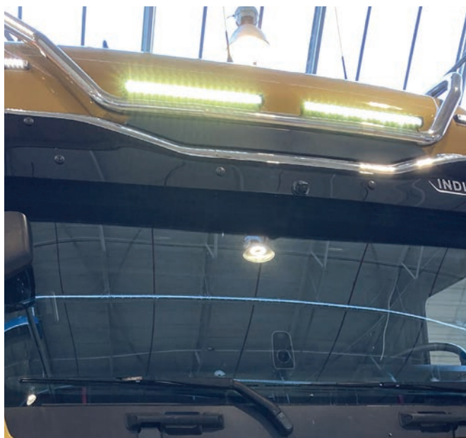
MAN Originální střešní světelné rampy a MAN originální dálková LED světla.

Prizpůsobte si své vozidlo pomocí originálního příslušenství MAN a zvyšte svou bezpečnost a pohodlí.